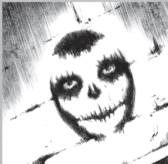
玩家资料4【苍白脸庞】